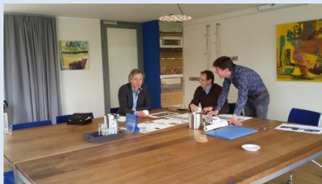
Gesprek bij Lombonet

De gemeente is nauw betrokken bij de uitwerking en de vervolggelassen.