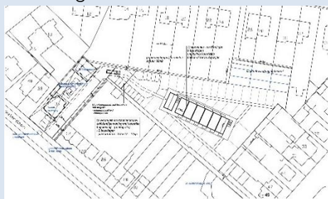
Uitwerking stadlandbouw met zorg.

De oorspronkelijk geplande laatste cocreatie-sessie van 26 oktober jl. is benut om de variant stadslandbouw met zorg te verrijken. In een rondetafelgesprek is met verschillende instanties in het gemeentehuis hierover gesproken. Hier waren o.a. Atelier Totem, Woningbouwvereniging De Combinatie en verschillende buurtbewoners aanwezig. Het was een constructieve avond met verschillende uitwerkingsideeën!